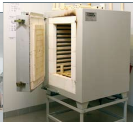
▲ Uanset form og figur er brænding af ler en favorit. Keramikovne placeres bedst i separate rum med selvstændig ventilation.

Store arbejdsborde på hjul og mobile tavler. Praktisk opbevaring af de mange materialer og udstyr opnås bedst i velindrettede dobbeltskabe. Elevernes brug af maling og farver giver splat og sprøjt, så gode skylle- og vaskefaciliteter er et væsentligt element i lokalet.