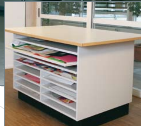
▲ Skærebord med papirreol. Praktisk løsning for opskæring og opbevaring af papir.