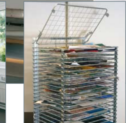
▲ Mobil tørrereol. Uundværligt redskab i et billedkunstlokale.