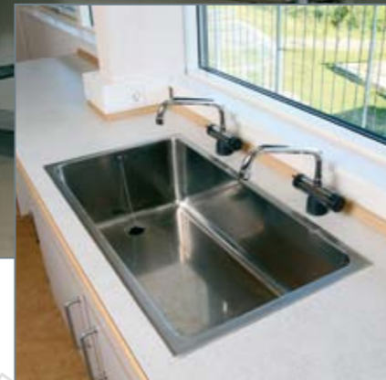
▲ Praktisk bred skyllevask med dobbelt armatur og god dybde kan betjenes af flere elever samtidig.