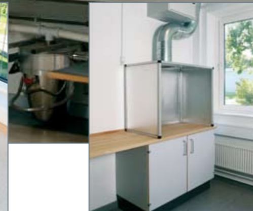
▲ Mini sprøjtekabine med udsugning til mindre sprøjtelakeringsopgaver.