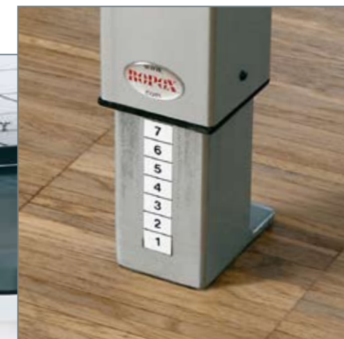
▲ Ergonomi og fleksibilitet i fokus - med højdeindstillelige borde kan alle være med.

ST Skoleinventar A/S' løsninger er synergi mellem stor viden om ergonomiske principper og konsekvent brug af de mest holdbare materialer.