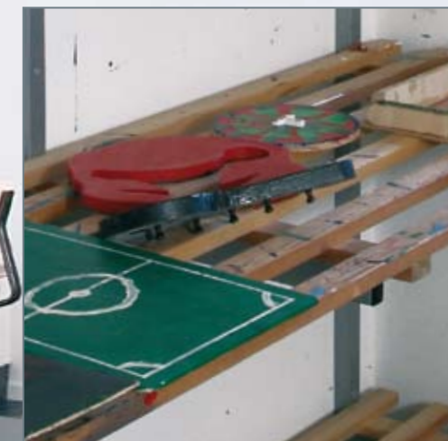
▼ God plads til tørring eller opbevaring af igangværende projekter er en fordel. Kan med fordel anvendes til både billedkunst og sløjd.