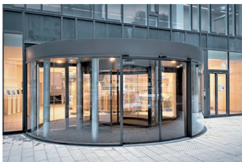
Nordfløjen Rigshospitalet, Danmark

Helende arkitektur, høj hygiejne og ekstrem funktionalitet leveres alt sammen af dørautomatik fra GEZE.