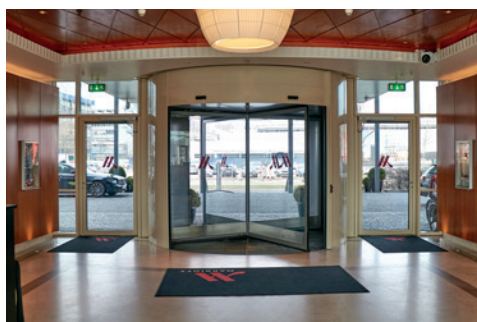
Marriott Hotel, København, Danmark

GEZE's automatiske dørsystemer i høj kvalitet sørger for sikkerhed og lang holdbarhed til daglig brug.