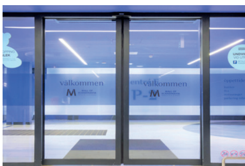
Mall of Scandinavia, Sverige

Helende arkitektur, høj hygiejne og ekstrem funktionalitet leveres alt sammen af dørautomatik fra GEZE.