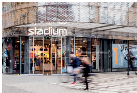
Åhlens-bygningen, Uppsala, Sverige

Med en lang række løsninger, sikrer GEZE's dørautomatik barriererfri tilgængelighed på steder, hvor mennesker er ekstra sårbare.