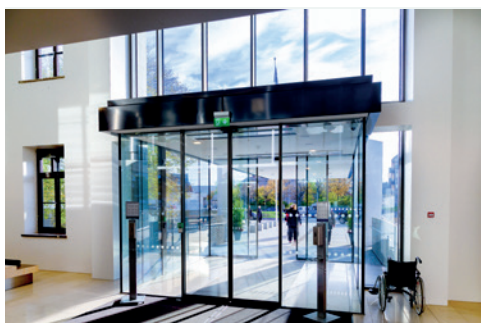
Norlands Hospital, Norge

GEZE's automatiske dørløsninger bidrager til elegant design, nem tilgængelighed og fokus på bæredygtighed.