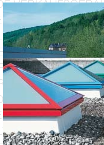
Grundschule, Ludwigstadt LAMILUX CI-System Glasarchitektur FP