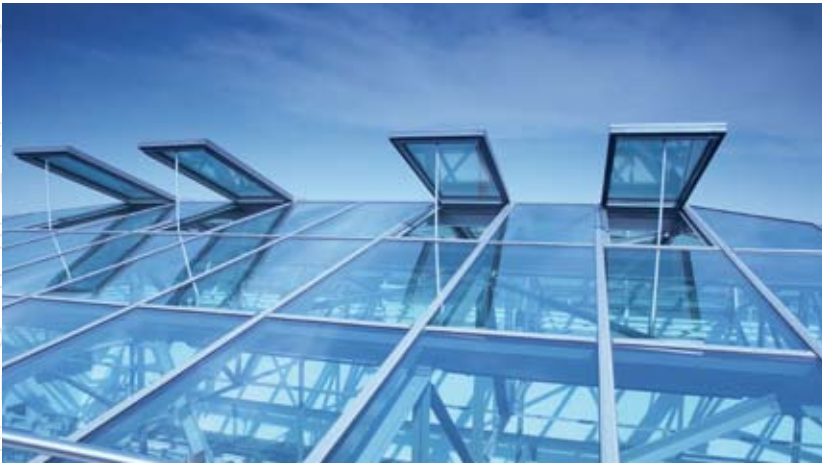
Musikhochschule, München LAMILUX CI-System Glasarchitektur KWS 60