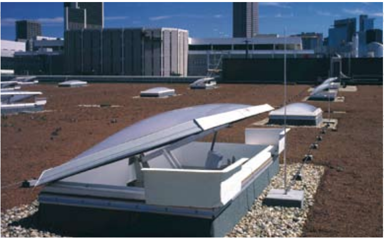
Messe Frankfurt LAMILUX CI-System Rauchlift DH