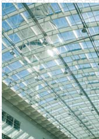
Messe Hamburg LAMILUX CI-System Glasarchitektur KWS 60