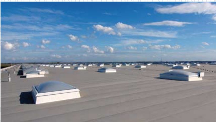
ProLogis, Galanta-Gan Slowakei LAMILUX CI-System Rauchlift F80 / LAMILUX CI-System Lichtband B