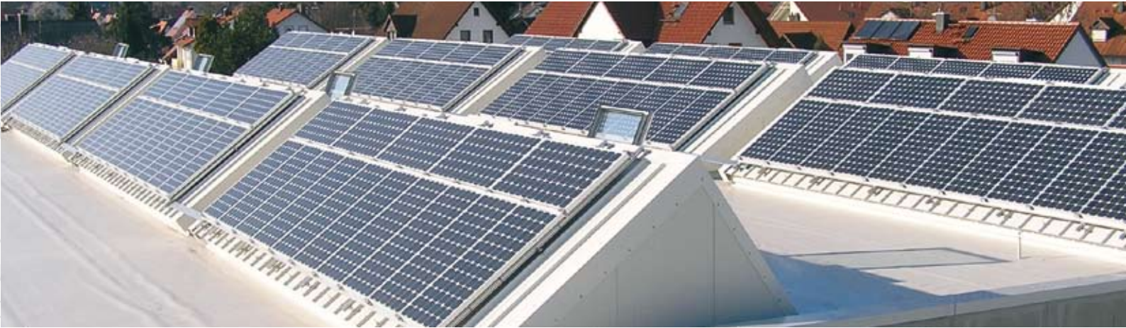
HAWE Hydraulik, Freising LAMILUX CI-System Glasarchitektur KWS 60 mit Photovoltaikelementen auf der Südseite