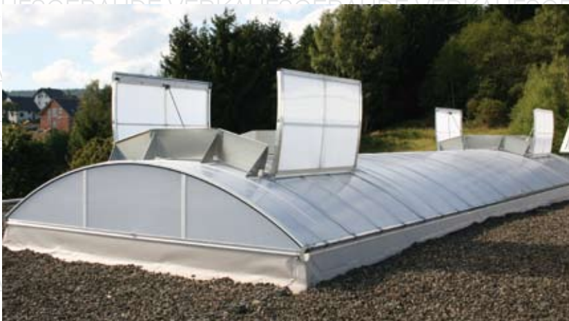
Frankenhalle, Naila LAMILUX CI-System Lichtband B