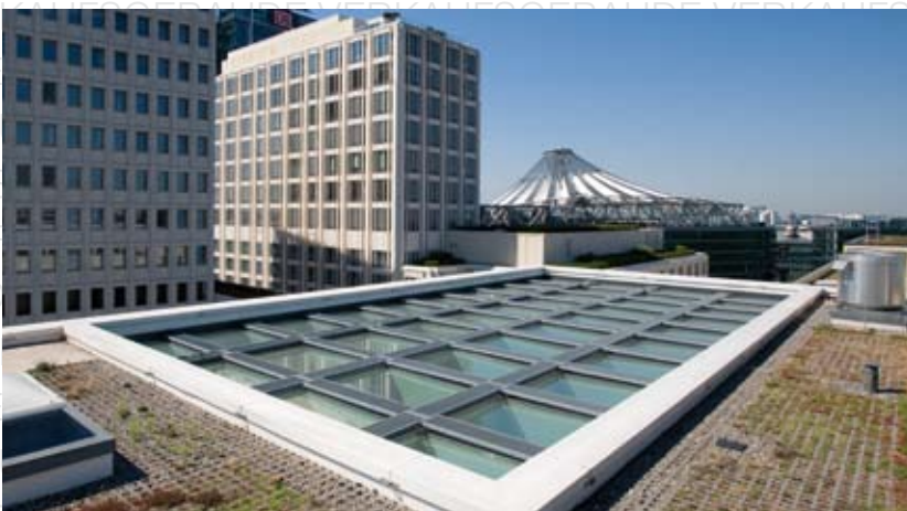
Marriott Hotel, Berlin LAMILUX CI-System Glasarchitektur KWS 60