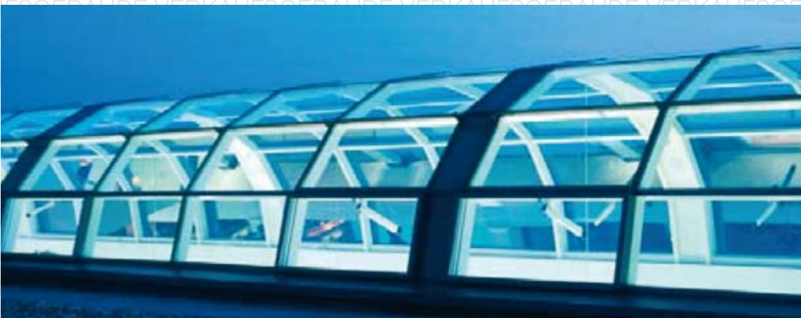
Stadtgalerie, Lengdenfeld LAMILUX CI-System Glasarchitektur KWS 60