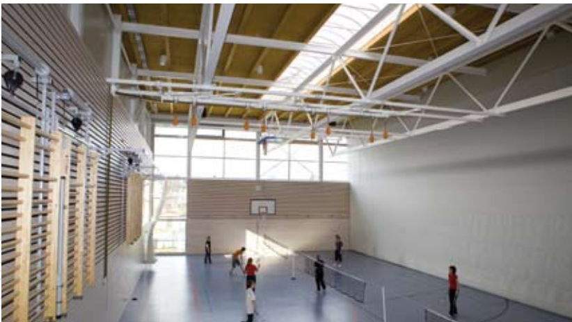
Rudolf-Lion-Sporthalle, Hof/Saale LAMILUX CI-System Lichtband B