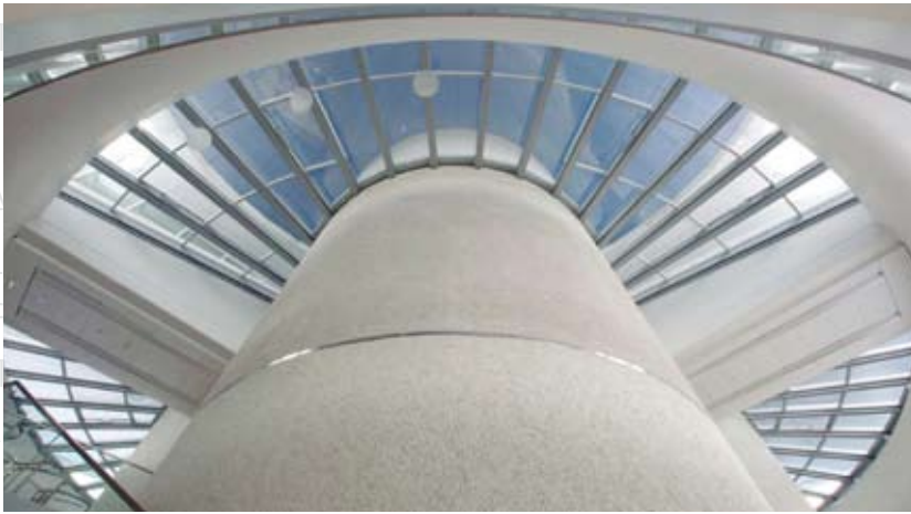
„BMW-Vierzylinder“, München LAMILUX CI-System Glasarchitektur KWS 60