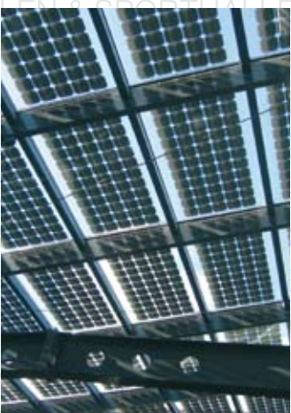
Federspiel GmbH, Bad Staffelstein LAMILUX CI-System Glasarchitektur KWS 60 mit scheinintegrierter Photovoltaik