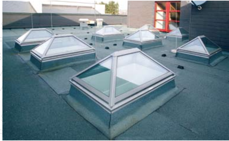
Berufsbildungswerk, Hof LAMILUX CI-System Glasarchitektur FW