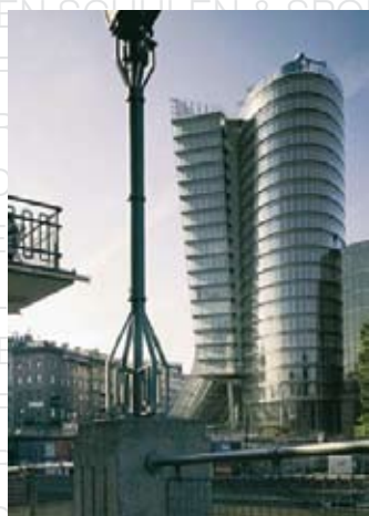
UNIQA Versicherung, Wien LAMILUX CI-Control Steuerungstechnik