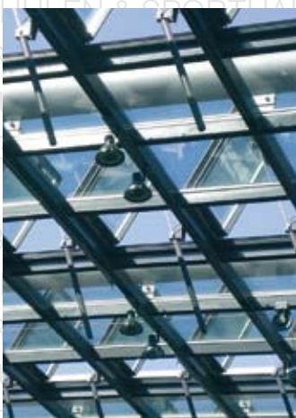
Schloss-Arkaden, Braunschweig LAMILUX CI-Control Steuerungstechnik