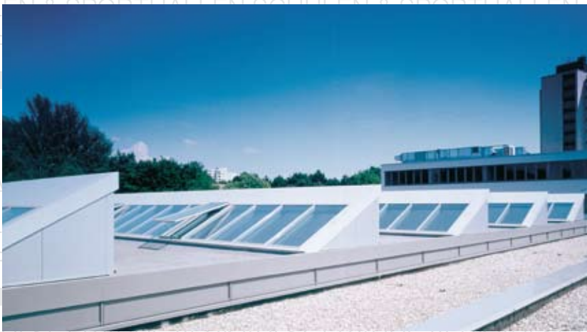
Europäische Schule, Frankfurt/Main Shedverglasung LAMILUX CI-System Glasarchitektur KWS 60